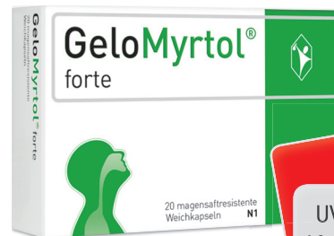
GeloMyrtol forte* 20 Kapseln