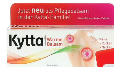
Kytta Wärmebalsam 100 g