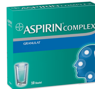
Aspirin Complex Granulat* 10 Beutel