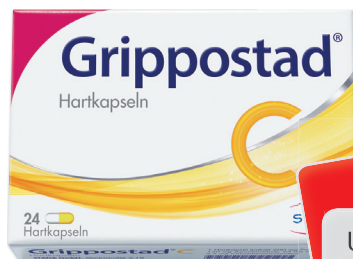
Grippostad C* 24 Kapseln