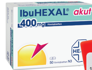
IbuHexal akut 400* 50 Tabletten

6,00 € gespart AAP 1 19,90 € 13,90 € 100 g = 11,58 €