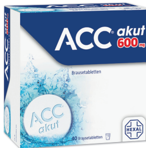
ACC akut 600* 40 Brausetabletten