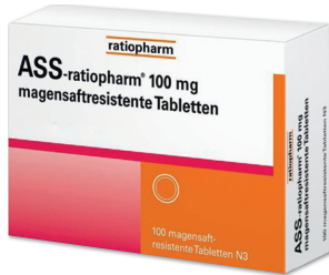
ASS-ratiopharm 100 mg magensaftresistente Tabletten 100 Tabletten