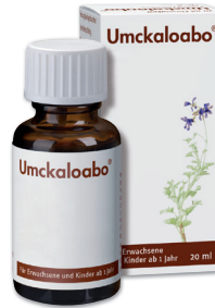
Umckaloabo* 20 ml

33 % gespart AAP 1 10,50 € 6,95 € 100 ml = 34,75 €