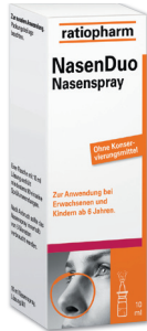
NasenDuo Nasenspray* 10 ml