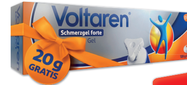
Voltaren Schmerzgel forte 23,2 mg/g* 20 Jahre Jubiläumsedition 100 g + 20 g gratis

GeloMyrtol® forte. Anw.: Zur Schleimlösung u. Erleichterung des Abhustens b. akuter u. chron. Bronchitis. Zur Schleimlösung b. Entzündungen der Nasennebenhöhlen (Sinusitis). Z. Anw. b. Erwachsenen, Jugendlichen u. Kindern ab 6 Jahren. Enth. Sorbitol.